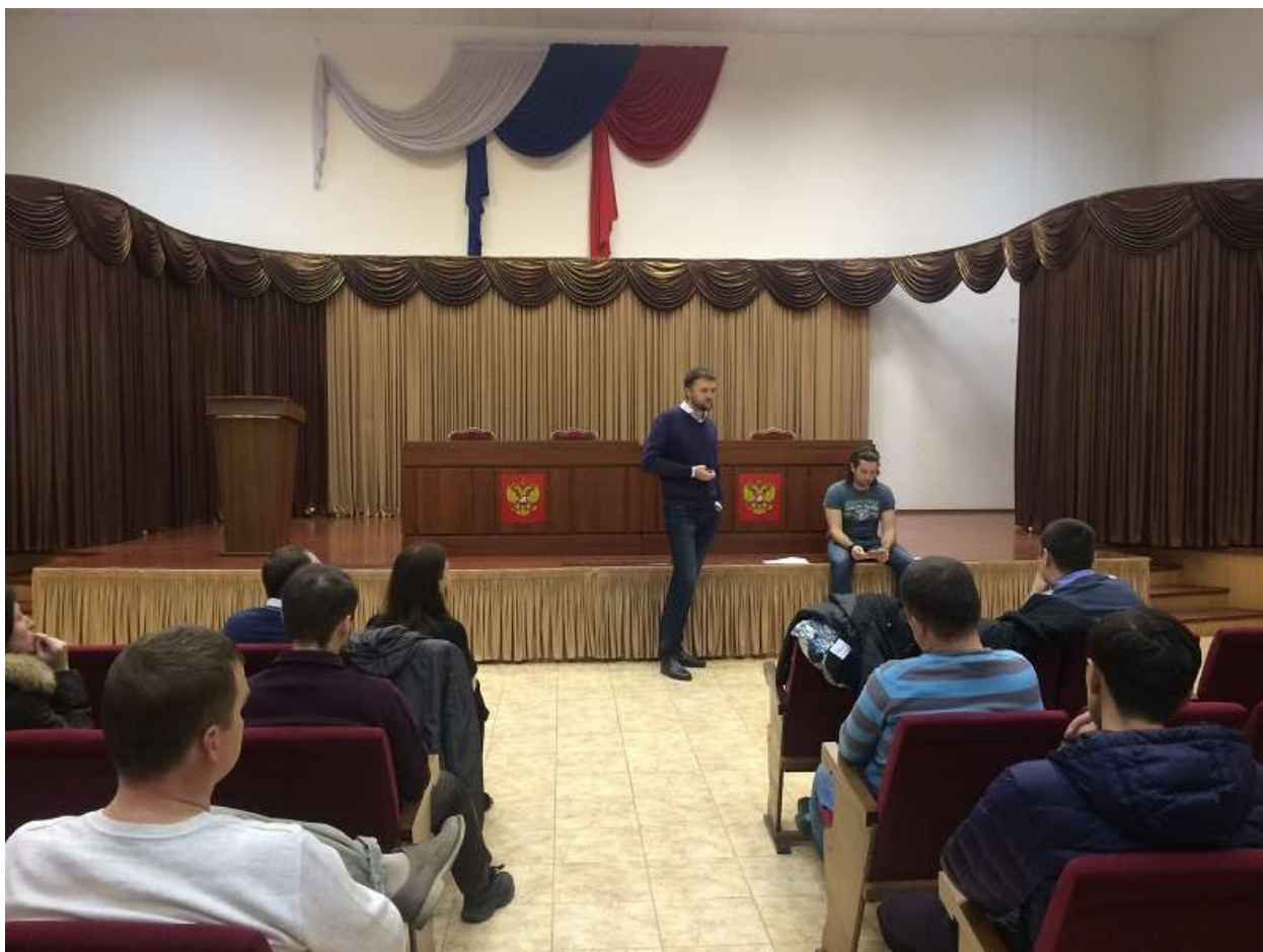
Фото 1. На собрании сторонников МОД «Гражданский союз Сосенского» 14 ноября 2015 года

В ходе состоявшегося разговора участники собрания обсудили мониторинг государственных и муниципальных закупок применительно к Сосенскому, перспективы дальнейшего жилищного строительства в поселении, работу местной полиции и добровольной народной дружины, отдельный сбор бытовых отходов, взаимодействие с другими общественными объединениями.