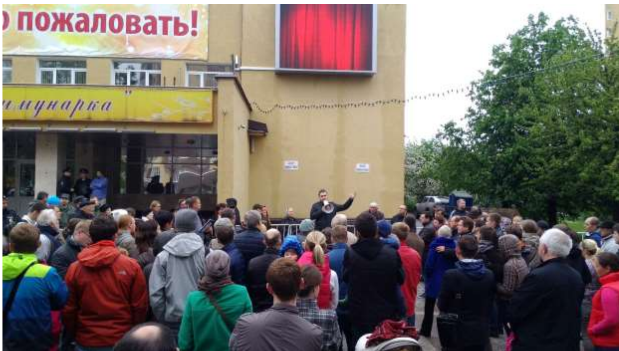
Фото 3. Митинг МОД «Гражданский союз Сосенского» в поселке Коммунарка 17 мая 2015 года.

После длительных переговоров и выполнения установленных процедур 17 мая с.г. состоялся митинг жителей поселка Коммунарка, организованный Гражданским союзом. На мероприятии членами совета Движения были озвучены основные проблемы, с которыми сталкиваются живущие в Коммунарке, решение которых составляет основную цель Гражданского союза. По итогам митинга было подготовлено коллективное обращение к органам государственной власти города Москвы, под которым подписалось 155 участников мероприятия.