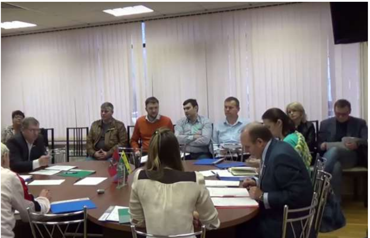
Фото 8. Члены Совета Движения, члены советов домов микрорайонов Эдальго и Гарден Парк на заседании Совета депутатов поселения Сосенское 16 апреля 2015 года

В рамках сложившейся в городе Москве практики, в целях разбора недостатков в работе управляющих организаций Гражданским союзом было инициировано заслушивание отчетов руководителей отдельных управляющих организаций (ООО «ЭКСПЕРТ-Сервис, ООО «УК «Термоинжсервис») на заседаниях Совета депутатов поселения Сосенское 19 марта и 16 апреля 2015 года (видеозапись доступна на сайте поселения).