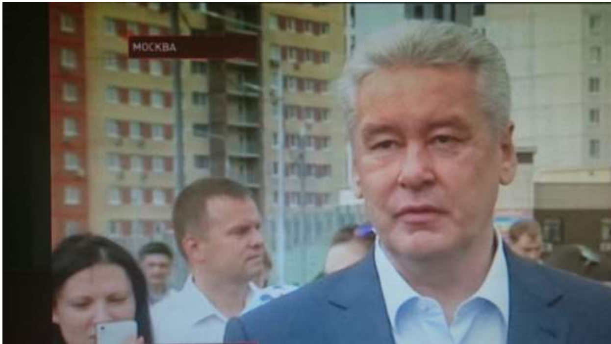
Фото 5. Заместитель Председателя Совета Движения А. Мошков и Мэр Москвы С. Собянин на открытии дорожного движения по улице А. Монаховой 1 июля 2015 года

В связи с изложенным, после официального открытия движения транспорта по реконструированной улице А. Монаховой, состоявшегося 1 июля 2015 года при участии Мэра города Москвы Сергея Собянина и членов Совета Движения, Гражданским союзом подготовлены предложения, направленные на обеспечение безопасности пешеходов и других участников движения на этой улице.