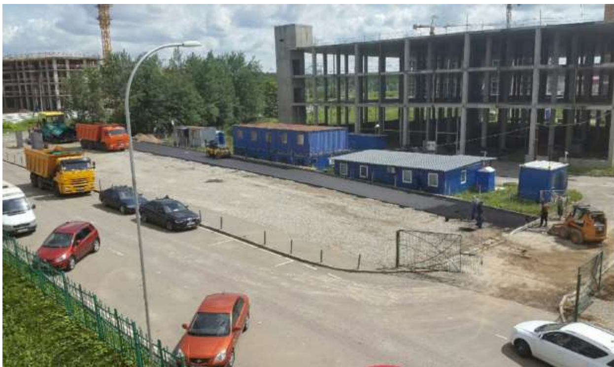
Фото 6. Строительство парковки вблизи ООО «Лавандерия»

крытого паркинга и вблизи автобусной остановки «микрорайон Эдальго» соответственно).