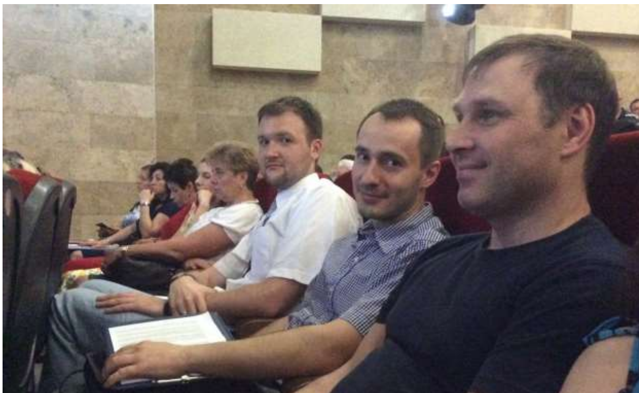
Фото 4. Члены Совета Движения на встрече с Префектом ТиНАО Д.Набокиным 24 июня 2015 года

социальной инфраструктуры, функционирования жилищно-коммунального хозяйства и т.п.