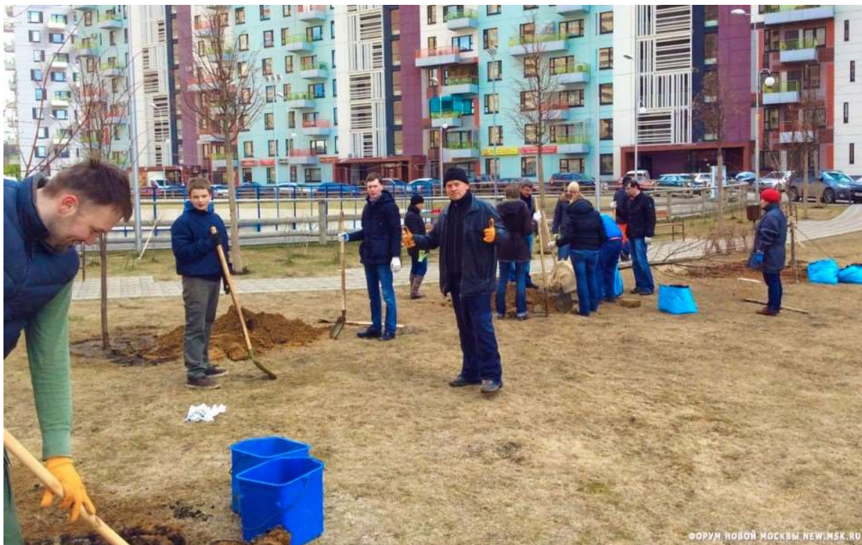
Фото 7. Члены Совета Движения на субботнике в микрорайоне Эдальго 25 апреля 2015 года

Деятельность по озеленению поселка ведется и вне связи с традиционными весенними субботниками. В октябре участниками Движения продолжены посадки саженцев в микрорайоне Эдальго и на улице Бачуринской.